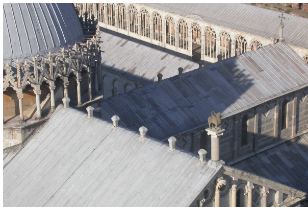
2. La Cattedrale ed il Camposanto visti dalla Torre

categorico brandiano 3 di trasmissione al futuro di questa ingente eredità. In questo suo compito la particolare realtà giuridica di un ente il cui ruolo si configura come "cerniera" tra controllo pubblico e gestione privata favorisce, mediante procedure più snelle, il monitoraggio costante dell'intero complesso monumentale, attraverso un "sapere" che è il risultato della commistione fra una tradizione fatta di antichi mestieri e pratiche di bottega e moderne metodologie di intervento, supportate da strumenti informativi all'avanguardia.