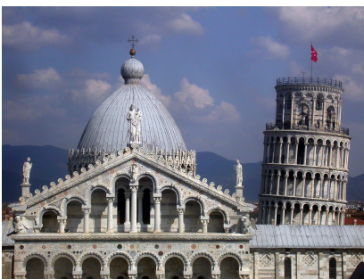
1. La Cattedrale e la Torre viste dal Battistero

[...] Svanito l'iniziale stupore, la prima curiosità si rivolge istintivamente al Campanile, la celebre Torre Pendente. Anche a me accadde la stessa cosa e fin dal primo istante mi parve incomprensibile l'ipotesi sostenuta da molti che questa Torre sia stata progettata così appositamente. [...] quella di Pisa non si può osservare se non con profondo rincrescimento per la sua inclinazione, che costituisce l'unica nota stonata in un insieme di squisita armonia forse unico al mondo. 1