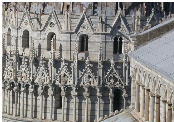
3. Il Battistero: dettagli del prezioso corredo scultoreo

Gli oltre 30.000mq di superficie lapidea di cui si compone la Piazza del Duomo, oltre alle consistenti parti decorative ed agli arredi, sono sottoposti così ad un monitoraggio costante da parte delle maestranze 4 dell'Opera Primaziale Pisana, le quali garantiscono anche l'attuazione degli interventi di manutenzione e restauro, sotto la diretta supervisione della locale Soprintendenza. Ogni fabbrica monumentale rappresenta dunque un cantiere in continua evoluzione.